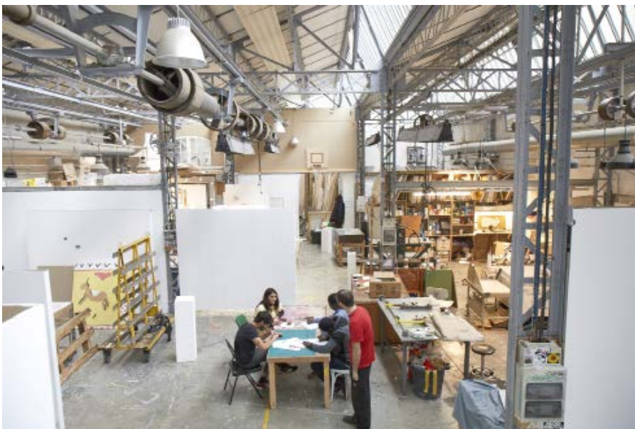
Vues de l'usine