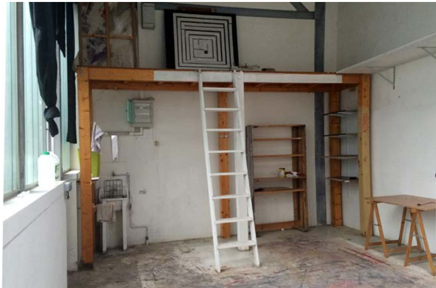
Vue d'un atelier type de l'allée