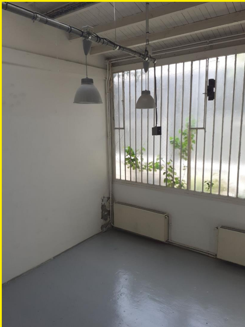
Un atelier type des allées